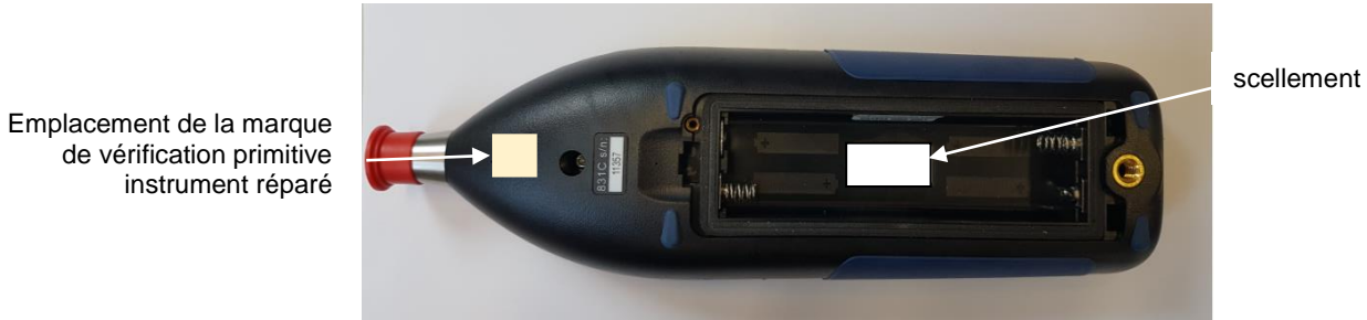
Photo du compartiment à pile

Un scellement portant la marque du fabricant ou du réparateur et destructible à l'arrachement est positionné au fond du compartiment à pile afin d'empêcher l'ouverture du sonomètre en recouvrant une vis (cf. photos ci-dessous).