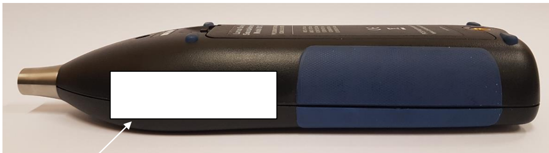
Emplacement de la marque de contrôle en service périodique

La marque de vérification primitive instrument réparé est disposée à l'arrière du boîtier.